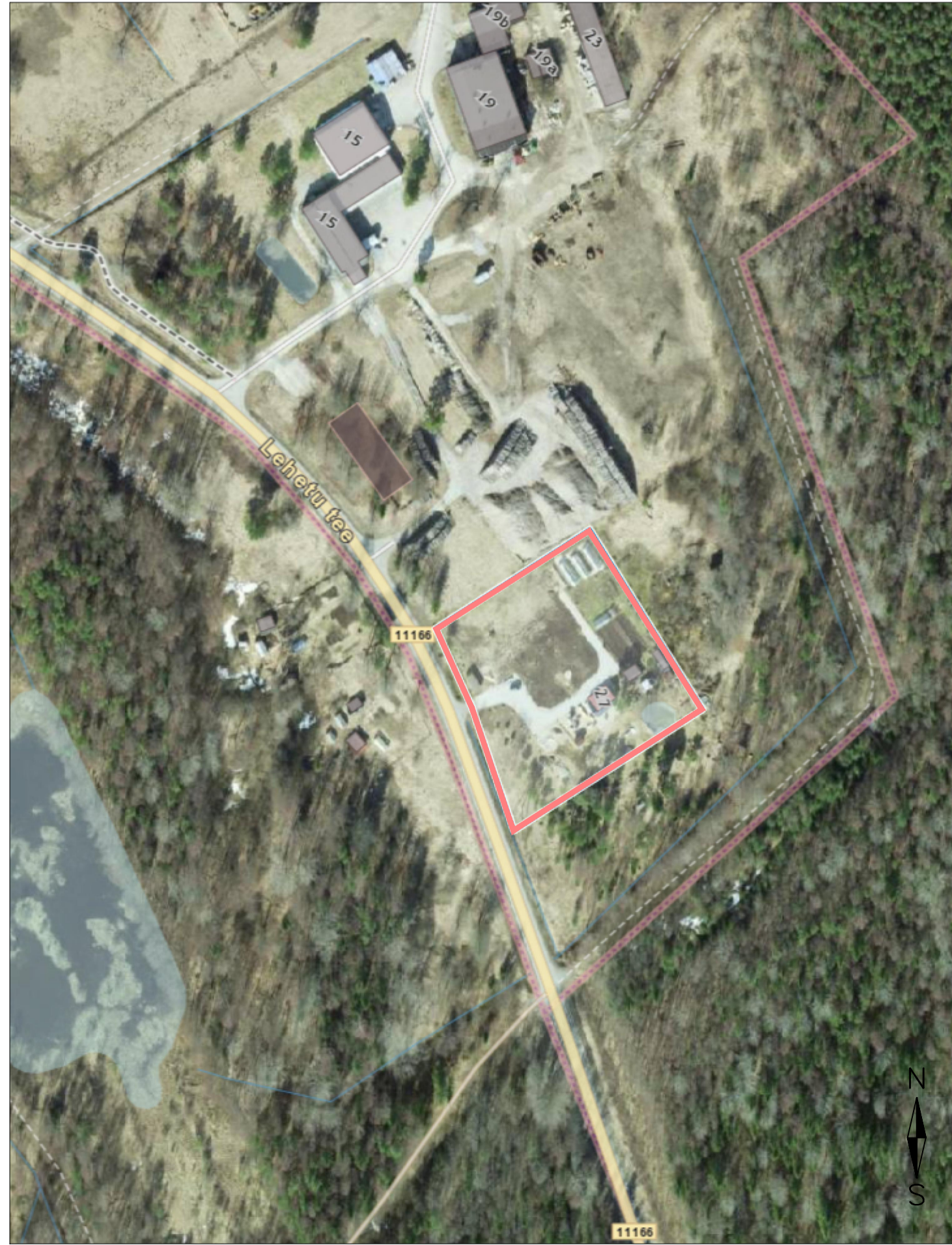
Asendiplaan Möötkava 1:2000 Kinnistu piir