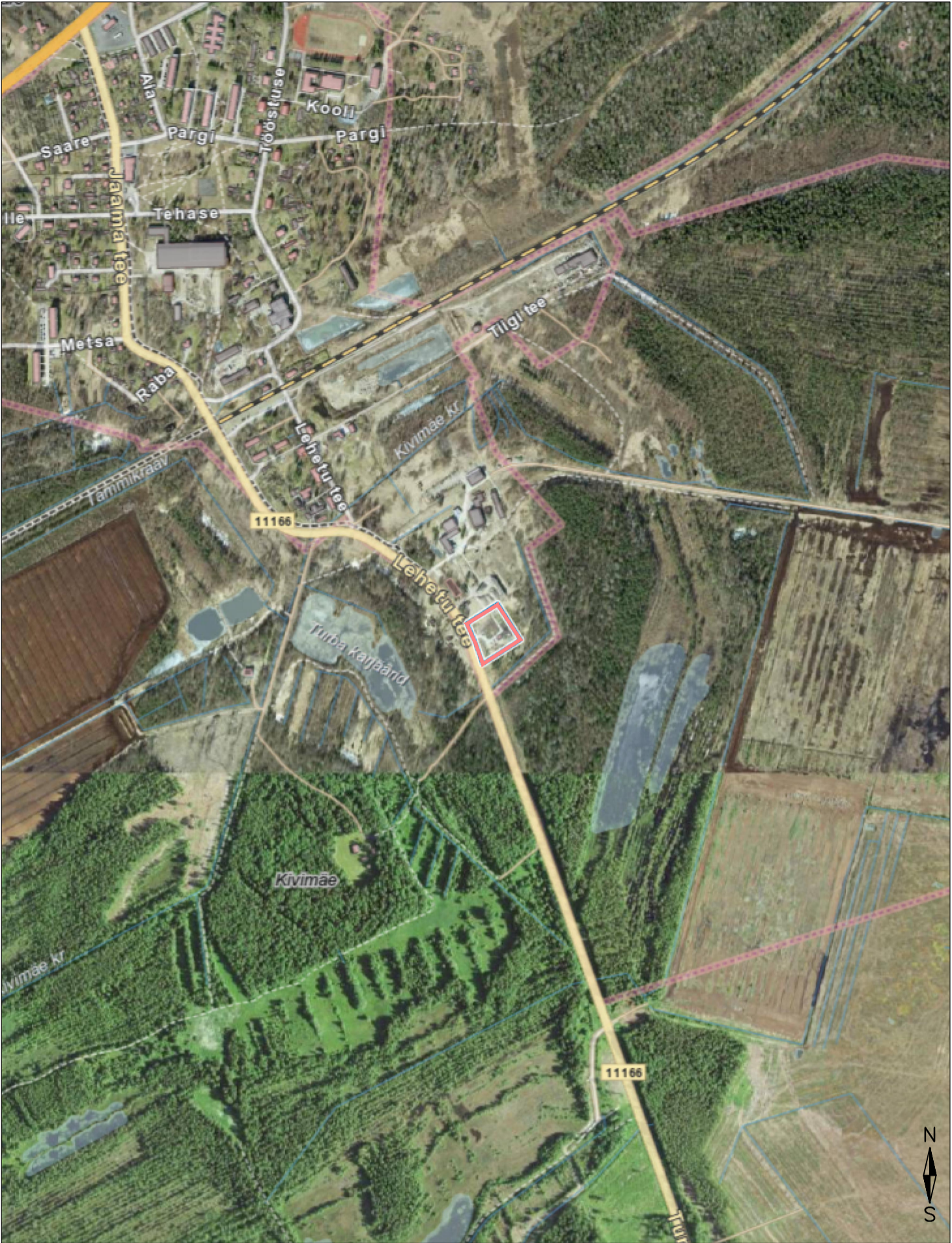
Situatsiooniskeem Möötkava 1:10 000 Kinnistu piir